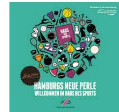
Corporate Design, Website & Megaposter Haus des Sports Hamburg