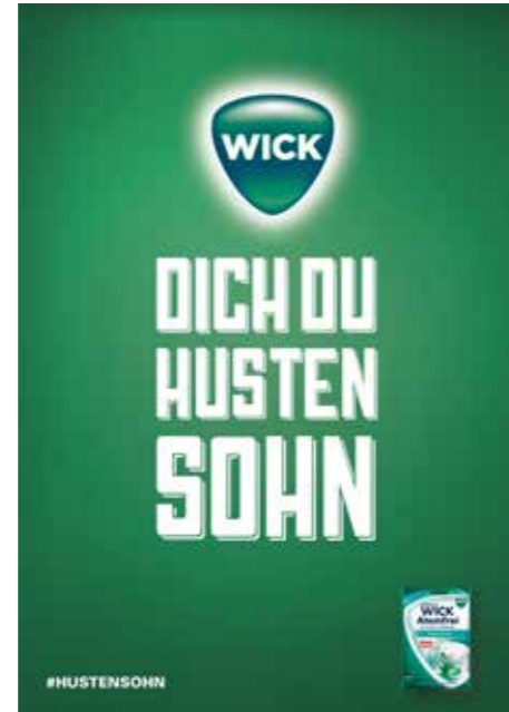
ADC NACHWUCHS SILBER NAGEL 2016 Printanzeige für WICK Hutentbonbons IN.D: David Küchenthal